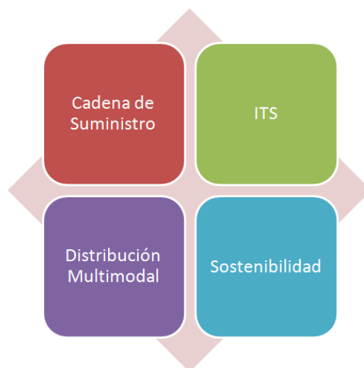
Figura 1: Áreas que componen el término Logística

A la vez, debido a la gran diversidad de conocimientos que se engloban bajo el término LOGÍSTICA, se han definido 4 áreas en las que se ha enmarcado la oferta existente: