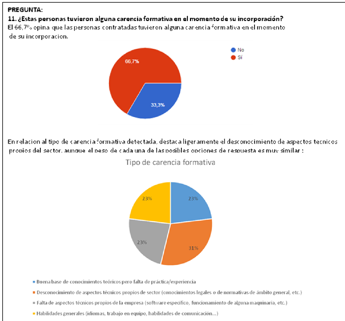
Figura 6: Respuesta Pregunta 11