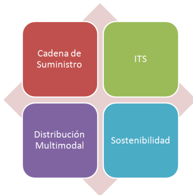
Figura 7: Áreas que componen el término logística

Debido al gran abanico de temáticas que tienen cabida bajo el término LOGÍSTICA, se han definido cuatro áreas para clasificar toda la oferta formativa. Estas áreas aparecen en la siguiente figura: